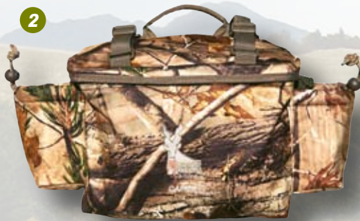
6/7 - L'Ibex vu de dos et de face.