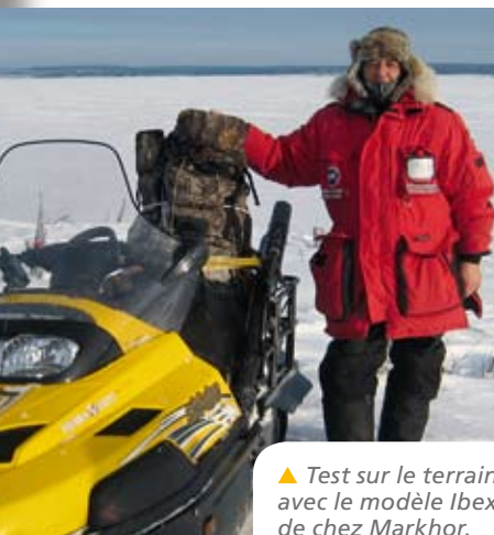
▲ Test sur le terrain avec le modèle Ibex de chez Markhor.

J.-P. Matéo : Tous les sacs à dos sont conçus pour porter des charges sur les terrains les plus difficiles et les plus extrêmes, mais la façon dont le contenu est chargé intervient grandement dans la stabilité et le confort de la charge. Idéalement, un objet léger, un sac de couchage par exemple, doit être chargé tout au fond du sac, ou dans le compartiment bas indépendant réservé à cet effet. Dans le compartiment principal du sac, les objets lourds doivent être rangés au milieu, les objets les plus